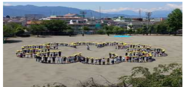
伊勢小学校創立100周年 記念撮影